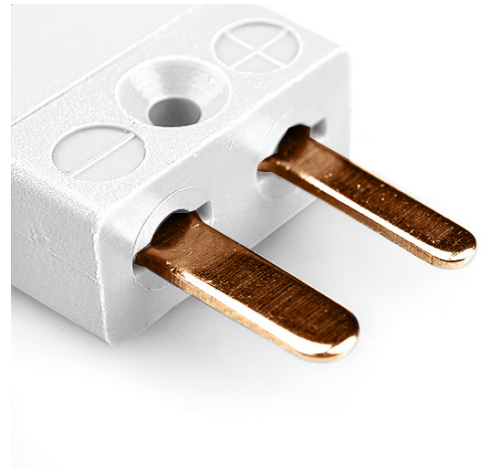
Miniature in-line Plug (dimensions in mm)

Labfacility are the UK's leading manufacturer of Temperature Sensors, Thermocouple Connectors and associated Temperature Instrumentation and stockings of Thermocouple Cables. The Company has been trading since 1971 and is ISO9001 accredited.